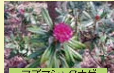
アズマシャクナゲ