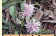
ショウジョウバカマ