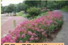
フロックス(オイランソウ)