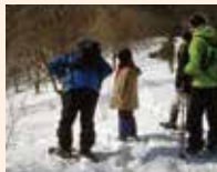
季節を感じる自然体験