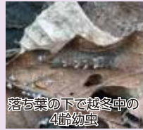
落ち葉の下で越冬中の4齢幼虫