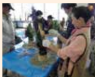
様々なものづくり体験