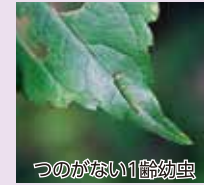
つのがない1齢幼虫