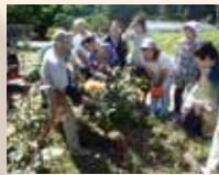
様々な緑を学ぶ教室