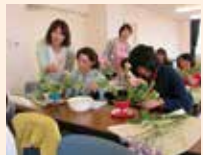
緑や花を楽しむ教室