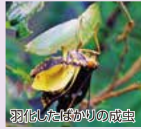
羽化したばかりの成虫