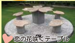
恋の花咲くテーブル