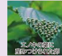
エノキの葉に産みつけられた卵

オオムラサキは全国の里山に棲息する美しい国蝶です。日本のタテハチョウ科の中では最大で、羽を広げると10センチにもなります。卵から幼虫、さなぎ、羽化、そして一生を終えるまで約一年。観察舎では、これら成長する様子を年間を通して観察することができます。なお、羽化は6月中旬頃から始まります。