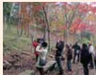
森を楽しむ観察会