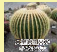
天皇家由来のキンシャチ