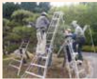
実技中心の剪定教室

公園事務所では、みどりの普及と啓発、県民レクリエーションの推進を目的に様々な体験教室や講座を開催しています。詳しくは公園ホームページや公園だよりをご覧ください。