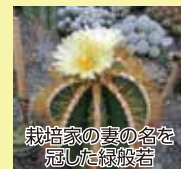
栽培家の妻の名を冠した緑般若