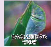
まもなく羽化するさなぎ