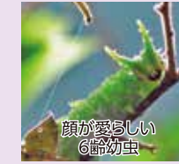
顔が愛らしい6齢幼虫